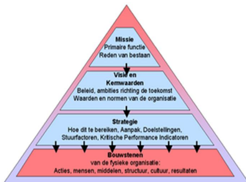
Figuur 1.2: Strategiedriehoek

Deze vragen worden beantwoord aan de hand van onderstaande driehoek, welke nader wordt beschreven in hoofdstukken 1 tot en met 5.