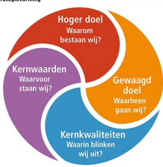
Figuur 1.1: Strategievorming

De Algemene Rekenkamer ziet genoeg kansen om, dit binnen de beleidsperiode 2019-2022, gefaseerd te bouwen aan een nieuwe organisatie. De Algemene Rekenkamer heeft deze kansen opgepakt en is middels een strategievorming tot een aangepast strategisch beleidsplan gekomen. Hierbij is het van belang dat het instituut haar doelen, kernkwaliteiten en kernwaarden duidelijk vooropstelt. In onderstaand figuur wordt de strategievorming die het instituut heeft doorgemaakt, weergegeven.